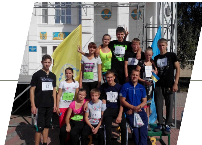
СТАРОБІЛЬСЬКИЙ ЛІЦЕЙ №4 2020– 2021