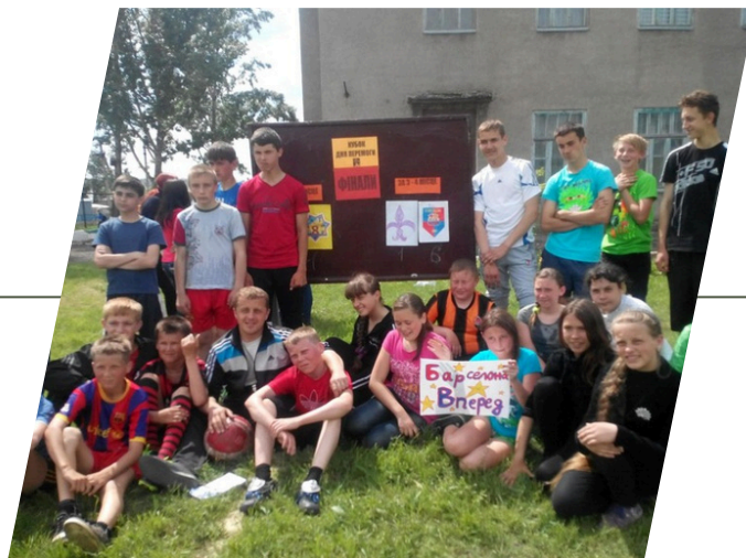
ВИШНЕВСЬКА ЗОШ 2009–2015