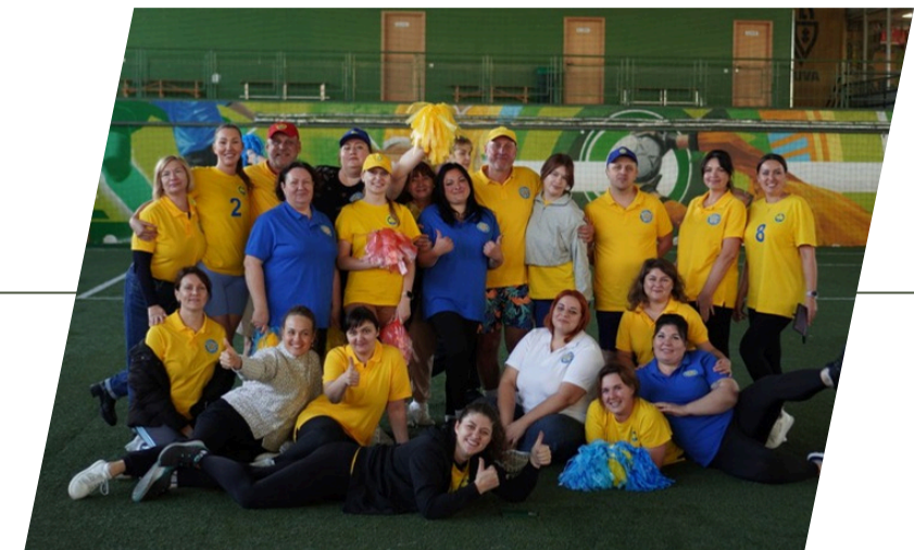
МІЖНАРОДНА УКРАЇНЬСЬКА ШКОЛА В ЛИТВІ М.КЛАЙПЕДА 2024 ДОТЕПЕР