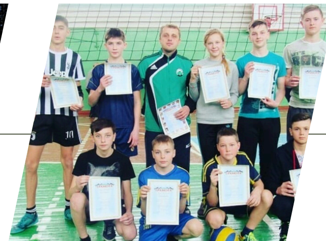
ВЕСЕЛІВСЬКИЙ ЛІЦЕЙ 2017–2022